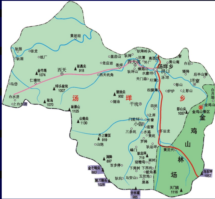
青田县汤垟乡行政区划卫星图

位于浙江省青田县政府驻地西南18公里。东靠仁庄镇,东南与瑞安、文成两县交界,西连阜山乡,北接仁庄镇吴岸村。2016年,全乡总人口6940人,下辖7个行政村(洪口、汤垟、垟寮、干坑、小佐、西天、西天坑),77个村民小组,2016年人均纯收入19614元。总面积79平方公里,其中耕地2345亩,林地72197亩。汤垟乡属亚热带季风气候区,年平均气温为18℃,年降水量约1700毫米。全县生态环境优越,负氧离子浓度基本都在每立方厘米3000个以上。境内金鸡山海拔1320.7米,为青田县第二高峰。立木蓄积量大,笋竹两用林资源有7000亩,新品种高山油茶1500亩。主要矿藏已探明的有山炮绿和萤石矿。该乡交通便利,省青岱线、230省道穿境而过。2017年提出了小城镇整治形象定位是“慢谷水都·侨乡汤垟”。